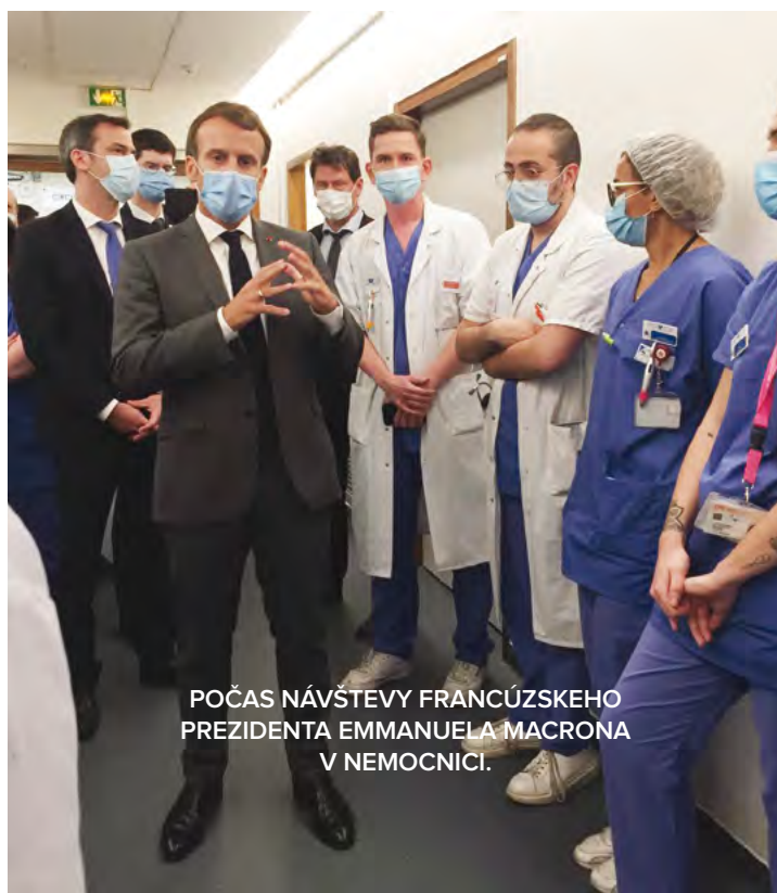
POČAS NÁVŠTEVY FRANCÚZSKÉHO PREZIDENTA EMMANUELA MACRONA V NEMOCNICI.