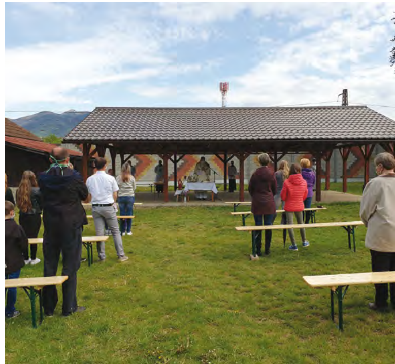
PO ZMIERNENÍ PROTIEPIDEMIOLOGICKÝCH OPATRENÍ SA VEREJNÉ SV. OMŠE KONALI V MÁJI NA RÔZNYCH MIESTACH NAŠEJ DIECÉZY NIELEN V KOSTOLOCH, ALE AJ VONKU. NAŠE ZÁBERY SÚ Z ČADCE (VLAVO) A SUČIAN.