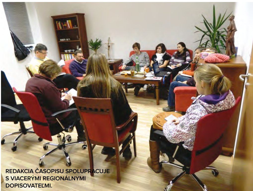
REDAKCIA ČASOPISU SPOLUPRACUJE S VIACERÝMI REGIONÁLNYMI DOPISOVATEĽMI.

Hovoríte, že jednou z úloh inštitútu je evanjelizovať súčasnú kultúru na území diecézy, koordinovať niektoré projekty. Aká je úloha kresťanov v tejto spoločnosti?