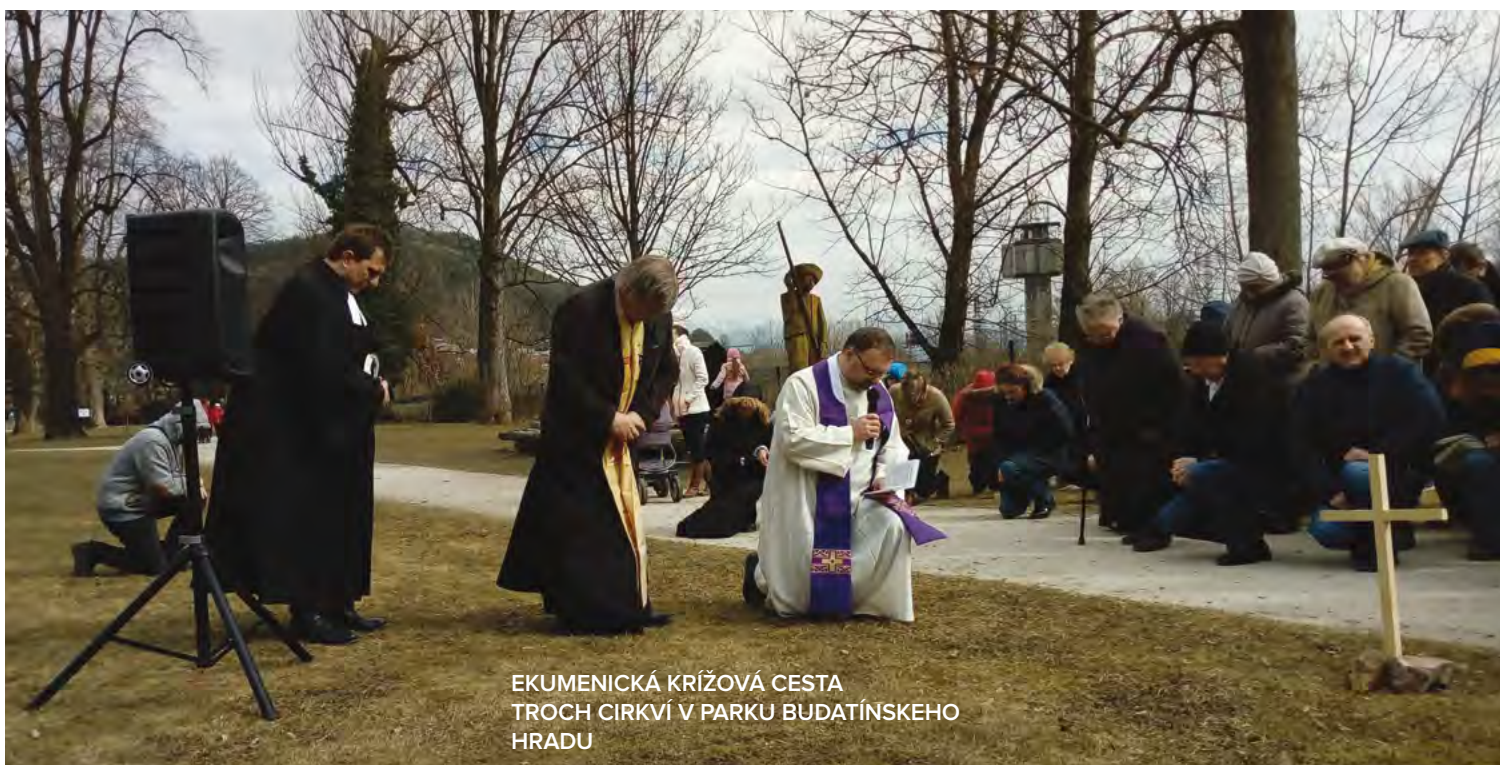
EKUMENICKÁ KRÍŽOVÁ CESTA TROCH CIRKVI V PARKU BUDATÍNSKEHO HRADU

Je tu ešte jedna oblasť, ktorá sa mi javí ako kľúčová v živote cirkvi na Slovensku – a to je otázka spoločenskej zaangažovanosti všetkých jej členov. Za určujúce považujem hľadať celospoločenský zmier, nie konfrontáciu. Len v pokoji a miere sa dá normálne žiť a rozvíjať. Napríklad v Jordánsku žije 92 %